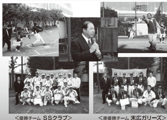
<優勝チーム SSクラブ>