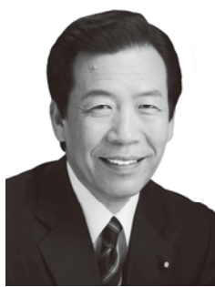
民主党国会対策委員長 衆議院議員 平野 博文

日頃よりご支援を頂いている皆様から感謝と共に、謹んで新年のご挨拶を申し上げます。