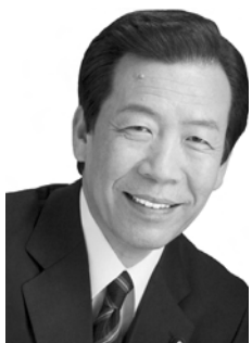
衆議院議員 平野 博文

昨年は様々な異変が続きました。安倍・福田と二代続く無責任な政権投げ出しは、国際的に見ても異常であり、信頼を損なうものです。