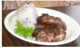
やわらか〜い 手作りぼた餅

ぼた餅、唐揚げ、すまし汁などを作り、みなさん持ち寄ってくださったお料理を詰めて、ボリュームたっぷり、なんとも豪華なお弁当が出来上がりました。(主婦のパワーはすごい！)