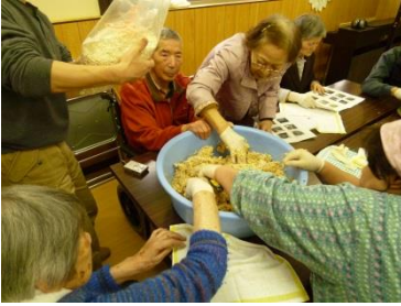
みなさん真剣に潰しています

二つ目のシマはホットケーキとおにぎり作り。ホットケーキは一人二枚ずつでぴったり人数分出来上がり。さらに、おにぎりを次々と素早く握っていく様子は本当にお見事でした。料理がお上手なんですね。