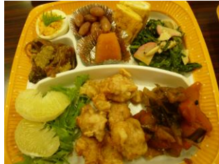
メインは揚げたての唐揚げ。 めだにツクシに春爛漫♪