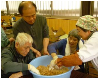
手で潰すのは大変でしたが...

テーブルを3つのシマに分けて、作業を分担しました。まずは本日のメインとなる味噌づくり。前日から煮ておいた大豆を潰します。ミキサーを用意していましたが、しっかり煮えていたため全て手で潰せました。こうじを加えて、さらに捏ねていきます。少し粒が残る程度まで潰しなめらかになったら、お団子のように丸めて、空気を抜くため樽の中へ思いっきり投げ込みます。最後に少量のリカーをふって出来上がり。これから少なくとも半年寝かせます。