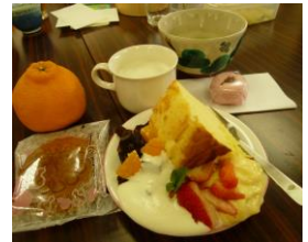
デザートもこんなに たくさん!

とても食べきれず、みなさん持ち帰りました。今年桜の見頃が短く、桜を観ながらとはいきませんでした。趣味の歌や太極拳を披露されたりワイワイと楽しいひとときでした。