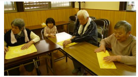
④ どう折ったらキレイに見えるかなあ