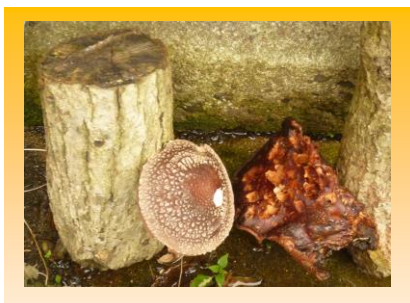
市立大の学生さんたちが、「置かせて」と事務所に持って来ていたホダ木から大きな椎茸が生えてきました。とても良い香りでした!

これからは紅葉が見頃を迎えますね。週末はどこに出掛けようかとワクワクします。(原)