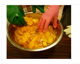
② 染料に浸して・・・